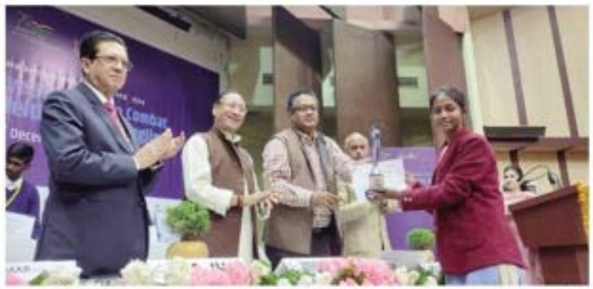
प्रगति इंकिया संवादवाता

पटना, ०६ दिसोबर २०२२ : सामीर क्रमार महासेत, उच्चेत्र न्येते, विशास सरकार ने बड़ा, " जालमाजी और तस्करों की समस्य बहुत जॉटल है। बोई बारूने निषम नहीं होने और बहुत कम सहयोग के कारण उपयोक्ताओं पर अमुर्गवत और आपवामी उत्पदीं का खला रहता है। उन्होंने कहा कि यह जरूरी है कि उपभोक्ता इस समस्या को बहुआयानी जॉटलवाओं को सम्बों। जानकता कार्यक्रम आयोजित करने का अपनी पर्संद और मानक्षार के मान्यम से बारबंद (अर्थणकाचा को यह करने वाली तस्वरी और जालसाओं जैसे पर्तिविधारों के विकासक व्यक्ति। द्वारा आयोजित कार्यक्रम जालबानी और शरकरों से लिएटने के लिए